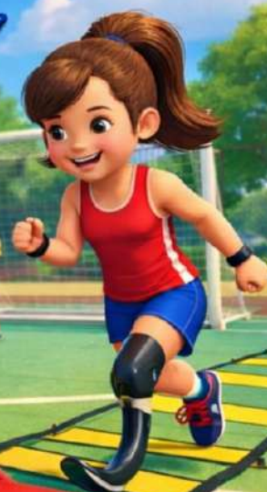
Carpeta de Campo