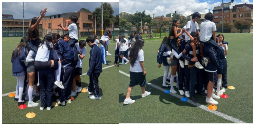
Fotografía 4: Construcción de la torre más alta