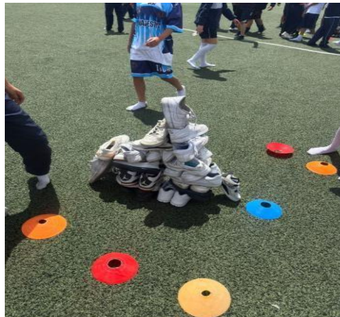
Fotografía 5: Búsqueda y organización de calzado