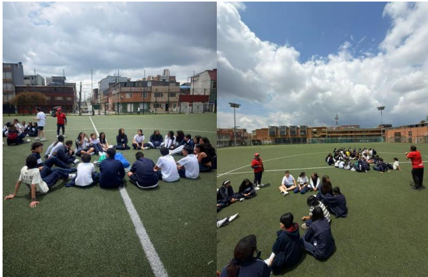
Fotografía 2: Selección de supervivencia